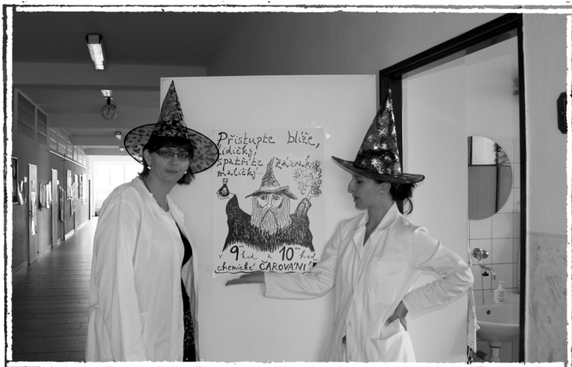
Obr. 4: Kolegyně chemikářky při projektovém dni s názvem „Butterfly effect“