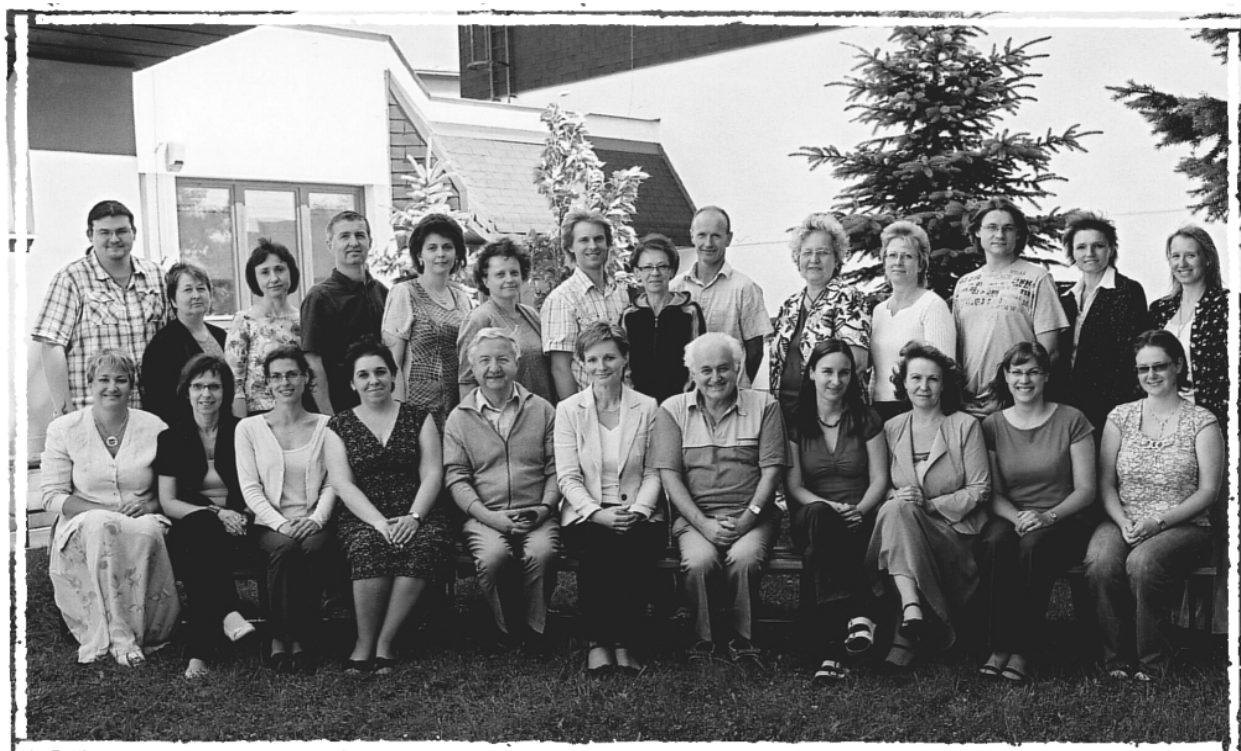
Obr. 3: Pedagogický sbor gymnázia ve školním roce 2008/2009