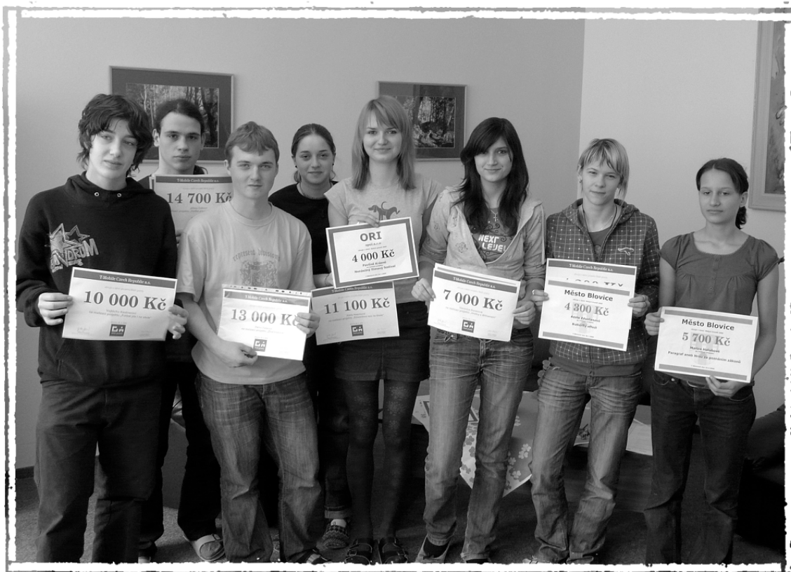
Obr. 5: Podpoření studenti se svým šekem potvrzujícím finanční podporu